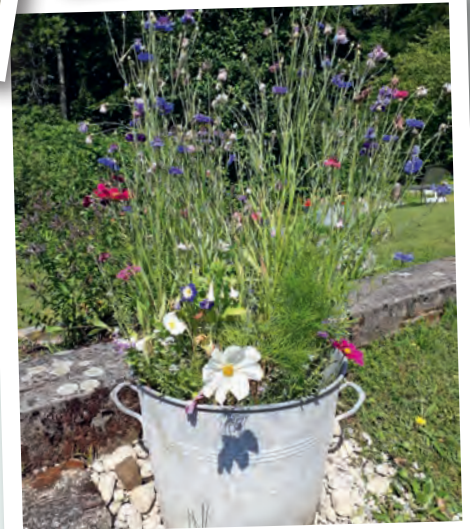
Ein letzter wunderschöner Blumengruss